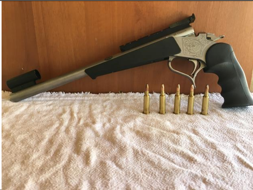
TC – CONTENDER CALIBRE .22 CLASSIC