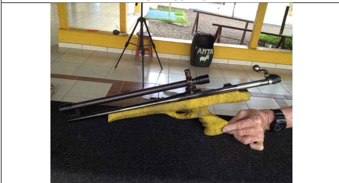
XP – 100 – REMINGTON CALIBRE 7 mm TCU (UGALDE)