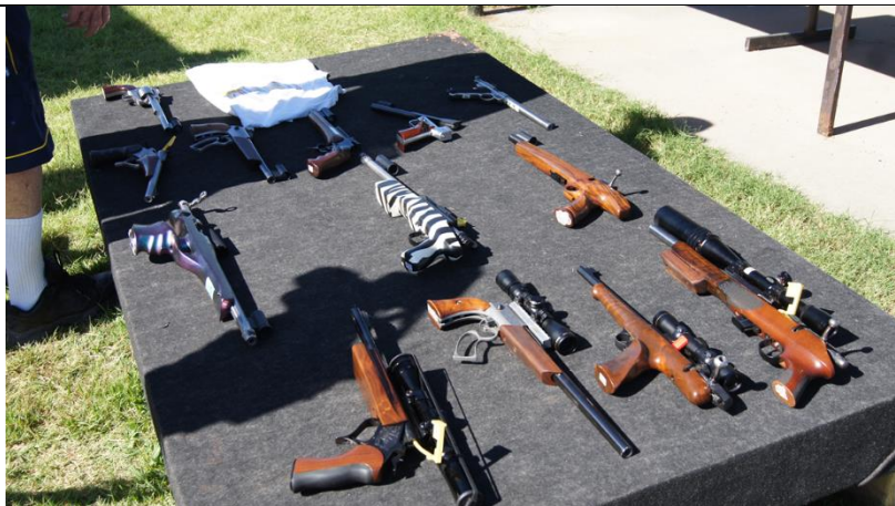
TIPOS DE ARMAS CURTAS PARA SILHUETAS