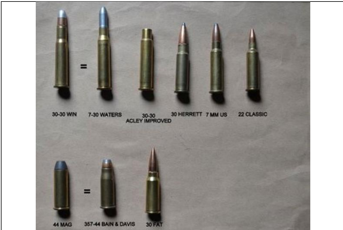
Calibres derivados de estojos 30-30 Win e 44 Mag.