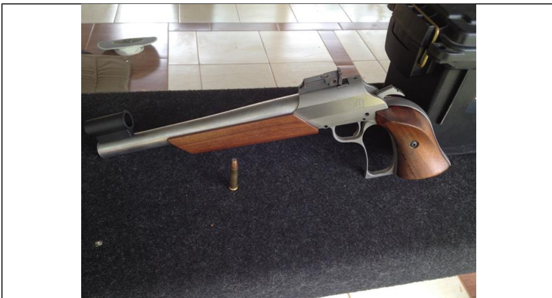
MOA – 30 - 20